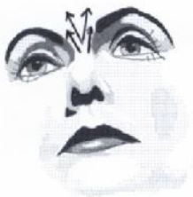
9) Zornesfalte ausstreichen