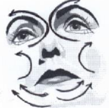
21) Großer Gesichtsausstreichgriff