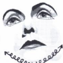
18) Friktionen unterhalb des Kinns