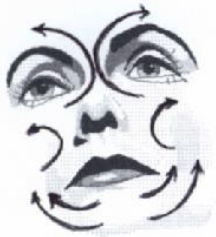
1) Großer Gesichtsausstreichgriff