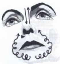
16) Friktionen in der Kinnrille