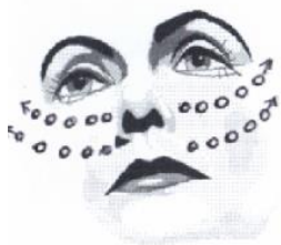
13) Bindegewebsmassage von Nasolabialfalte zu den Schläfen