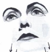
20) Seitlich den Hals ausstreichen von oben nach unten