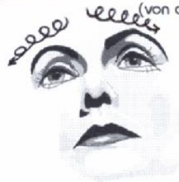
10) Friktionen auf der Stirn