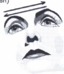
11) Stirn ausstreichen von Schläfe zu Schläfe