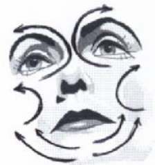
15) Großer Gesichtsausstreichgriff