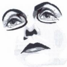
5) Kleiner Augenkreis