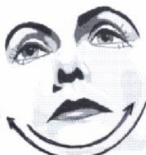
19) Ausstreichen der Kinnpartie von Ohr zu Ohr