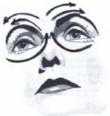
4) Großer Augenkreis