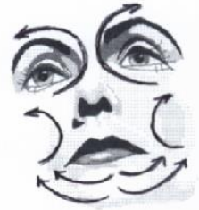
12) Großer Gesichtsausstreichgriff