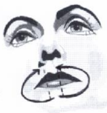
17) Mundringmuskel ausstreichen