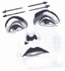
2) Stirn ausstreichen (Beruhigungsgriff)