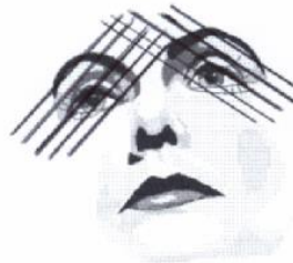
7) Augen zuhalten