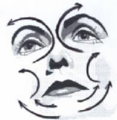
3) Großer Gesichtsausstreichgriff