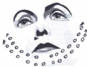
14) Bindegewebsmassage von Kinn zu den Ohren