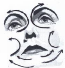
8) Großer Gesichtsausstreichgriff