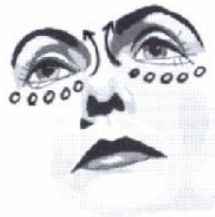
6) Massage am Jochbogenrand (von außen nach innen)